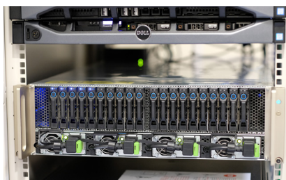
Tesla P100を8基搭載したNVIDIA DGX-1

デエイアイグノシスが現在研究しているテキスト分析では、「Word2vec」と呼ばれる手法等を用いている。これはテキストを